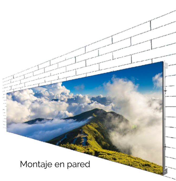
Montaje en pared